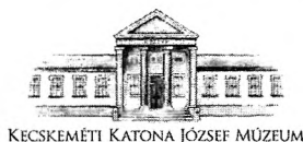
KECSKEMÉTI KATONA JÓZSEF MÚZEUM