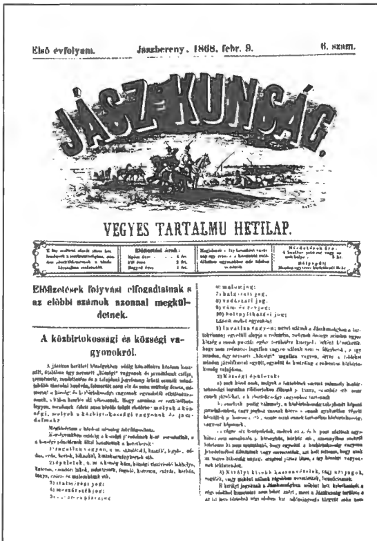
Gyárfás István cikke a birtokviszonyokról a Jász-Kunság újságban